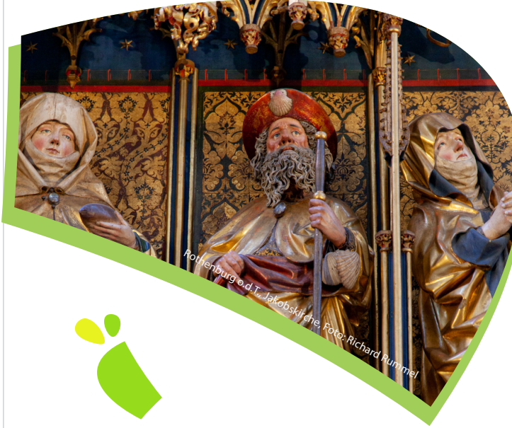
Rothenburg o.d.T. Jakobskirche, Foto: Richard Rummel