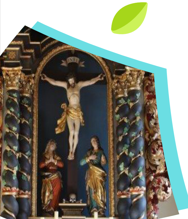
Uehlfeld - Altar in der St. Jakobus-Kirche - Foto: Daniela Seren

Wir verstehen Kirchenräume nicht als Museen, sondern als geistliche Räume. Es geht uns dabei nicht nur um die Vermittlung von Zahlen, Daten, Fakten, also von historischem Wissen. Besuchende und Gäste sollen auch in eine Begegnung mit dem Kirchenraum geführt werden, und in seinen Kunstwerken und Ausstattungsstücken Glaubens- und Lebensthemen entdecken und verknüpfen.