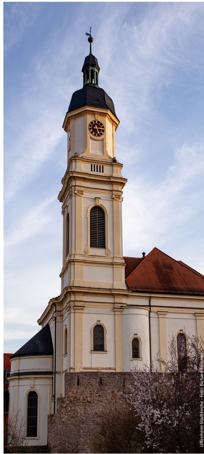
Uffenheim Stadtkirche