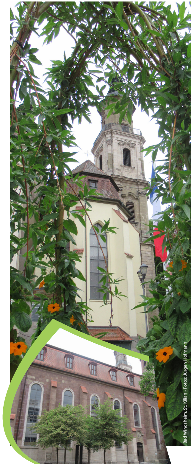
Bad Windsheim, St. Kilian - Fotos: Jürgen Hofmann

Kursgebühr und Material. An den Kurstagen werden Mittag- oder Abendessen in Gasthäusern selbst bezahlt. Bitte fragen Sie im Rahmen des Ehrenamtlichengesetzes der ELKB zur Finanzierung des Kurses vor der Ausbildung in Ihrem Pfarramt nach.